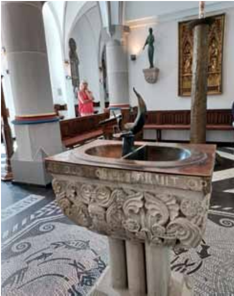
1e inzending: doopvont in de Biechtkapel in Kevelaer, door Ria Bouwmeester