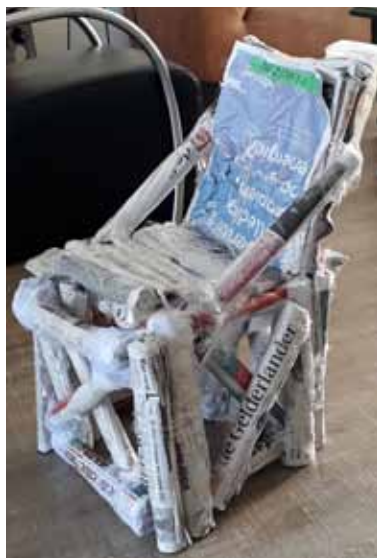
Nog een papieren stoel